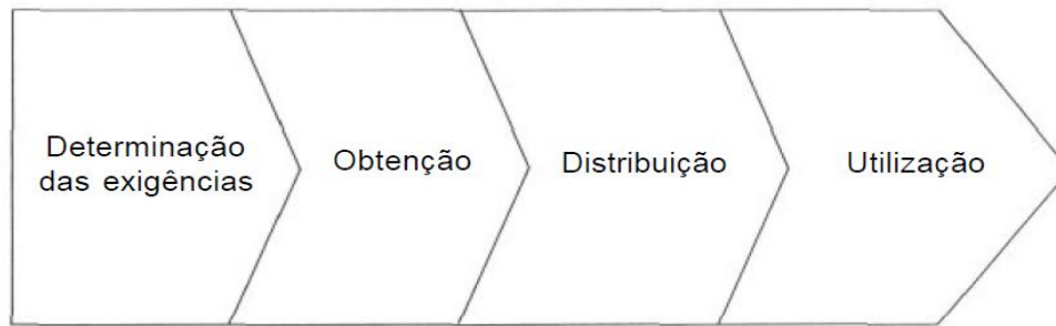
Figura 1 - Processo de gerenciamento da informação