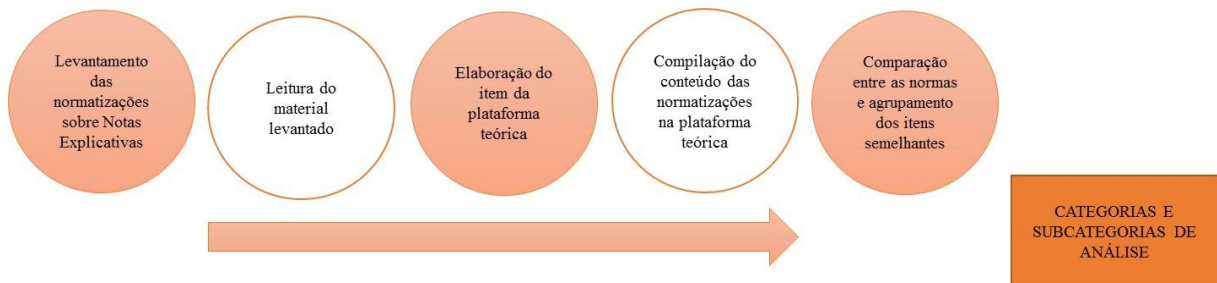
Figura 4 - Processo de elaboração das categorias e subcategorias de análise

Na visão de Franco (2012), a análise de conteúdo consiste em comparações contextuais, devendo ser direcionadas a partir da sensibilidade, intencionalidade e da competência teórica do pesquisador. Ainda, Franco (2012) afirma que os resultados da análise de conteúdo devem refletir os objetivos da pesquisa e se apoiar nos indícios da mensagem, capturados pelas comunicações analisadas. As categorias e subcategorias foram definidas com base nas diretrizes e orientações vigentes para a elaboração das Notas Explicativas, as quais compõem a plataforma teórica do presente trabalho, conforme as orientações de Martins e Theóphilo (2009). Adicionalmente, propõe-se a elaboração de algumas categorias complementares a fim de verificar os problemas descritos na OCPC 07 (2014), quanto ao conteúdo das Notas Explicativas. A Figura 4 apresenta o processo de elaboração das categorias e subcategorias as quais foram utilizadas na análise de conteúdo.