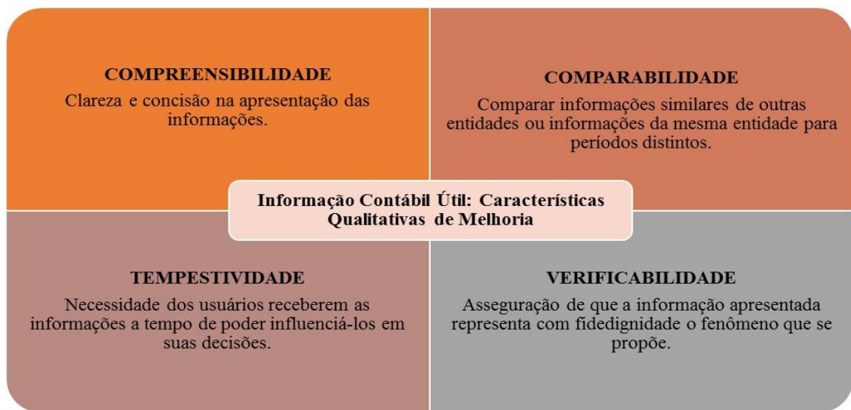
Figura 2 - Resumo das Características Qualitativas de Melhoria

De forma resumida, na Figura 2 estão apresentadas as quatro características qualitativas de melhoria inerentes a informação contábil útil, as quais buscam aprimorar a informação relevante apresentada com fidedignidade pela entidade que reporta a informação.