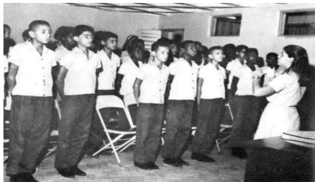
Fotografia 04 - Recitais de canto coral

Os alunos que pretendiam dar continuidade aos estudos na área artística, enquanto futuros profissionais tinham a possibilidade de conquistar o prêmio bolsa de estudos no Seminário de Música da Universidade da Bahia.