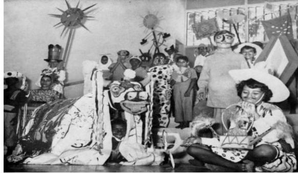
Fotografia 03 - Encenação do Bumba-meu-boi