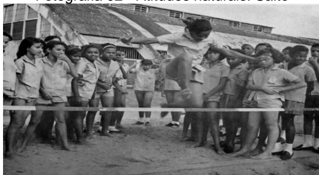
Fotografia 02 - Atitudes naturais: Salto

No pavilhão, ou nas áreas ao ar livre, a infância fervilha em movimento: marchas, galopes, saltos, arremessos, jogos de bola, ginástica, calistenia, aparelho em movimento, basquete, futebol etc. tudo funcionando como um grande ginásio esportivo, semelhante aos clubes em competição internacional. [...]. (EBOLI, 1969, p.55)