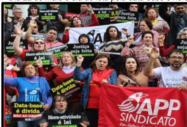
Imagem 1- Dia 22 de maio é dia de luta pela data-base e hora-atividade

As mobilizações pela hora-atividade no Estado do Paraná são intensas. O Estado sob a égide neoliberal agressiva ameaça as políticas educacionais que buscam melhorar o trabalho docente e a qualidade do ensino. Diante desse fato, em conformidade com as palavras de Scholochuski (2018) e Oliveira (2019), a hora-atividade não deve ser entendida como um benefício oferecido pelo governo, comparado a um momento de descanso remunerado acoplado na carga horária. A imagem 1 demonstra um ato de resistência: