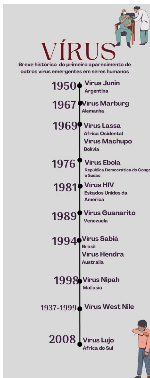
Figura 3 – Breve histórico do aparecimento de vírus em seres humanos